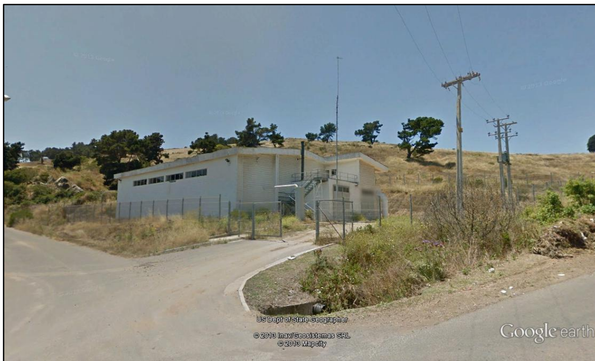
Figura IV.2.2. Planta de Tratamiento Preliminar de San Antonio.

En el punto de convergencia de las aguas servidas se cuenta con una planta de tratamiento preliminar de las aguas servidas, que comprende cribado, desarenado y remoción de grasas, y cuyo efluente es conducido hasta la cámara de carga que da inicio al emisario submarino.